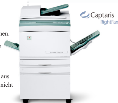
Document Centre 535

über das Xerox Alliance Partners Programm finden Sie unter www.xerox-solutions.com .