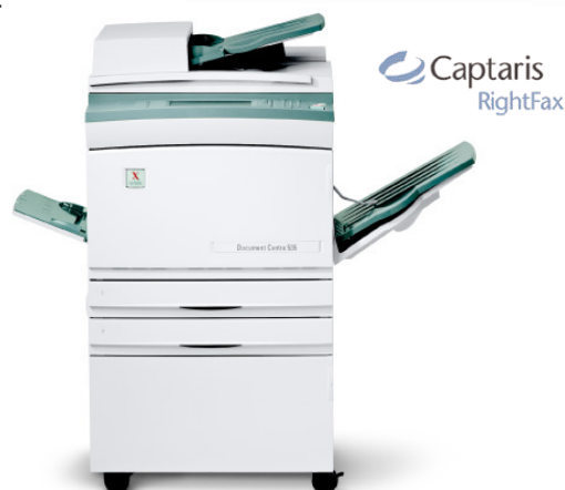
Document Centre 535